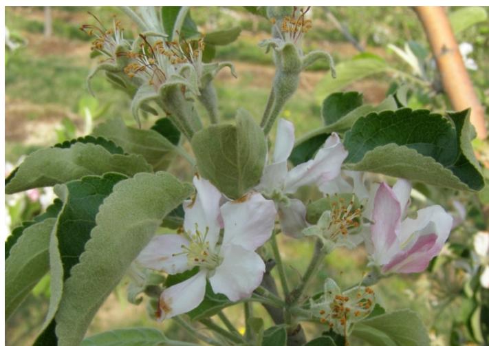
70 – 90% πτώσης πετάλων