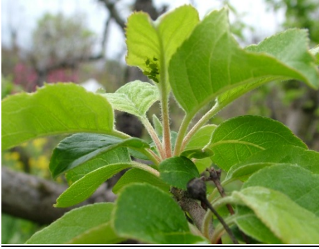
αφίδες στην κάτω επιφάνεια φύλλου