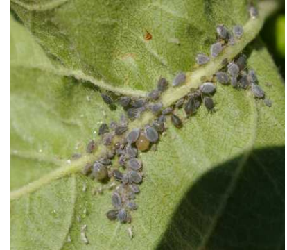
Dysaphis plantaginea ρόδινη αφίδα μηλιάς