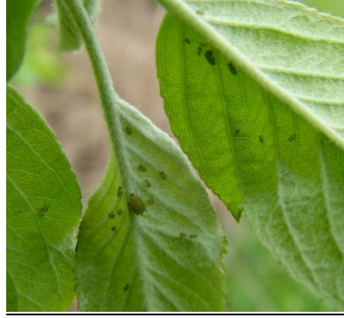
περίπου 15 άτομα πράσινης αφίδας