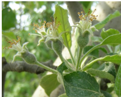
Η πλήρης πτώση πετάλων