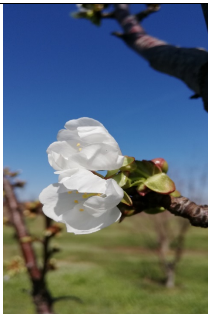
Λευκή κορυφή – Έναρξη άνθησης