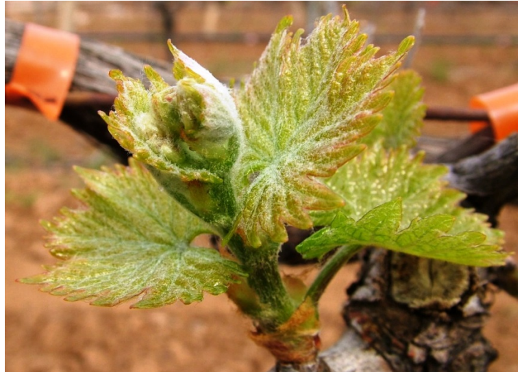
Στάδιο E (3 φύλλα, μήκος βλαστού τουλάχιστον 7 εκ.)