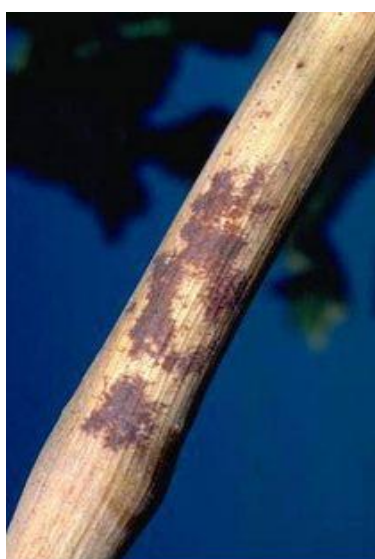
Κληματίδες με σκουρόχρωμες δικτυώσεις