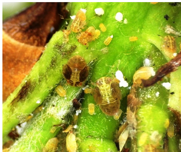
Αυγά και προνύμφες Cacopsylla pyri σε ταξιανθίες