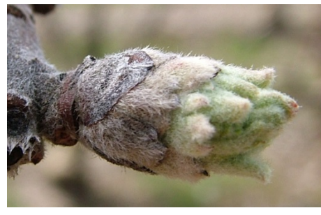
C 3 "αυτιά ποντικού" πράσινες κορυφές φύλλων εξέχουν από τα λέπια