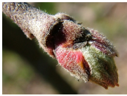
C Πράσινη κορυφή