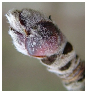
B Φούσκωμα οφθαλμών, διαχωρισμός λεπίων